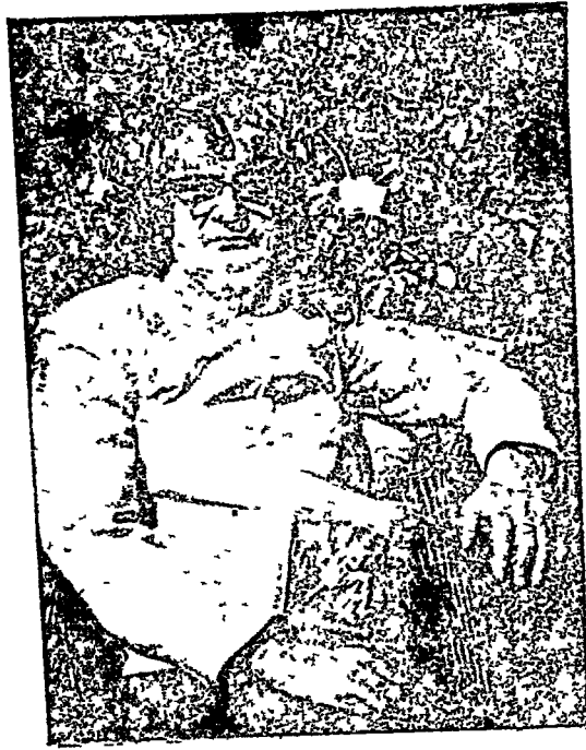
श्री सुमित्रानन्दन पंत